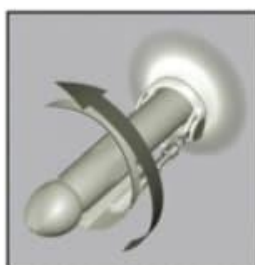
3. Fix the penis onto the penis enlargement device