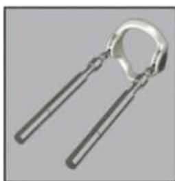
1. Adjust the extension rods according to the penis length