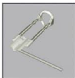
2. Fix the front piece and fixing strap onto the extension rods