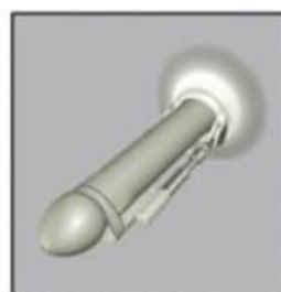
4. The penis enlargement device starts to work